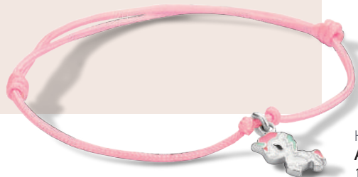
H964 ARMBAND 11 cm 11,50