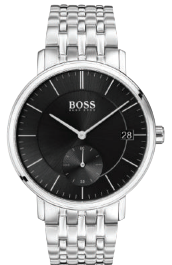
HB1513641 € 279,-