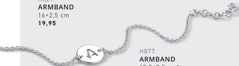
H877 ARMBAND 15,5+2,5 cm* 19,95