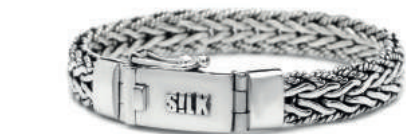
Art. 237 € 279