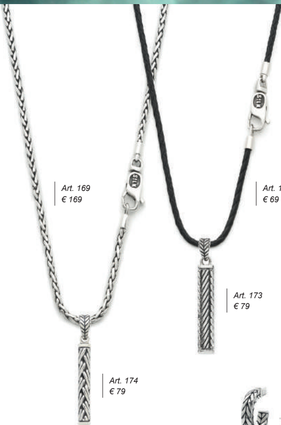
Art. 169 € 169