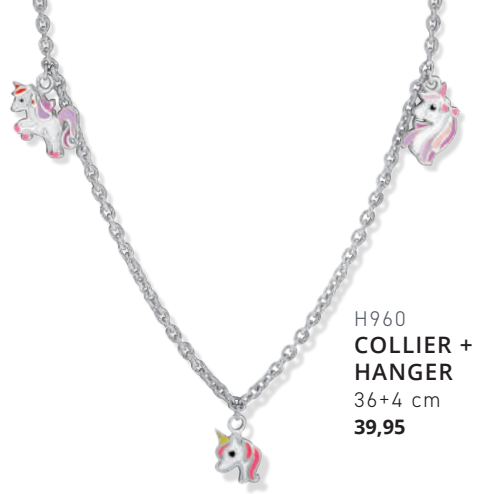
H960 COLLIER + HANGER 36+4 cm 39,95