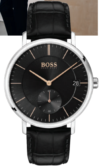
HB1513638 € 249,-