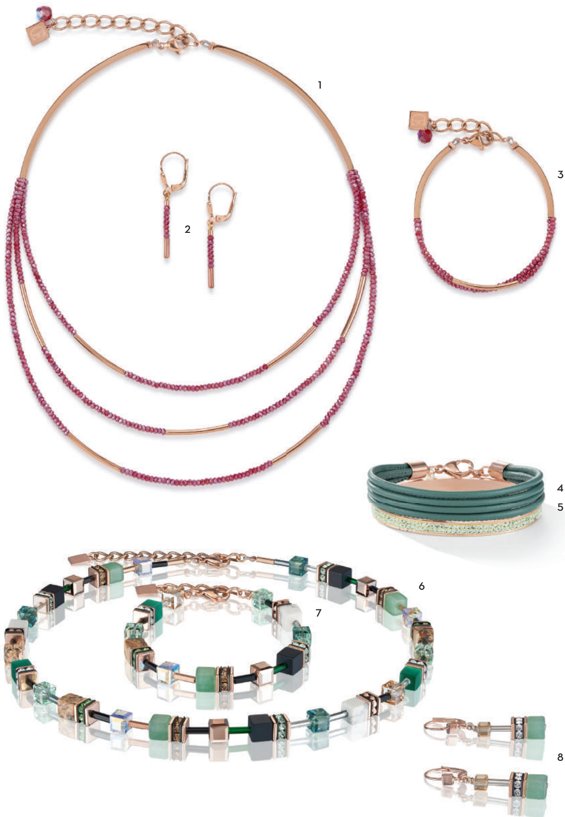
1 COLLIER 4960/10-0300 € 199 2 OORBELLEN 4960/20-0300 € 39 3 ARMBANDEN 4960/30-0300 € 79 4 ARMBANDEN 0219/30-0532 € 64 5 ARMBANDEN 0214/33-0520 € 75 6 COLLIER 4905/10-0510 € 199 7 ARMBANDEN 4905/30-0510 € 99 8 OORBELLEN 4905/20-0510 € 59