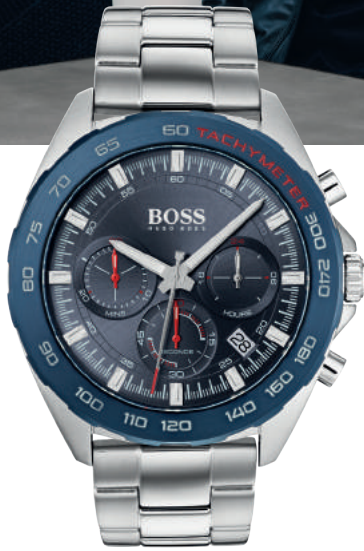
HB1513665 € 349,-