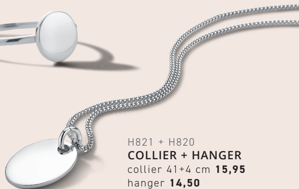
H821 + H820 COLLIER + HANGER collier 41+4 cm 15,95 hanger 14,50