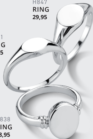
H847 RING 29,95