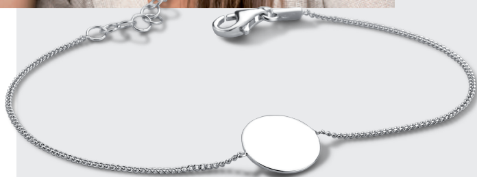
H829 ARMBAND 16+2,5 cm 19,95