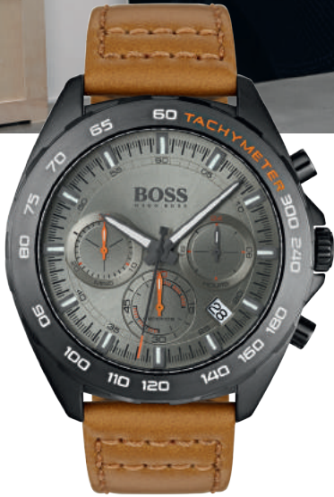
HB1513664 € 349,-