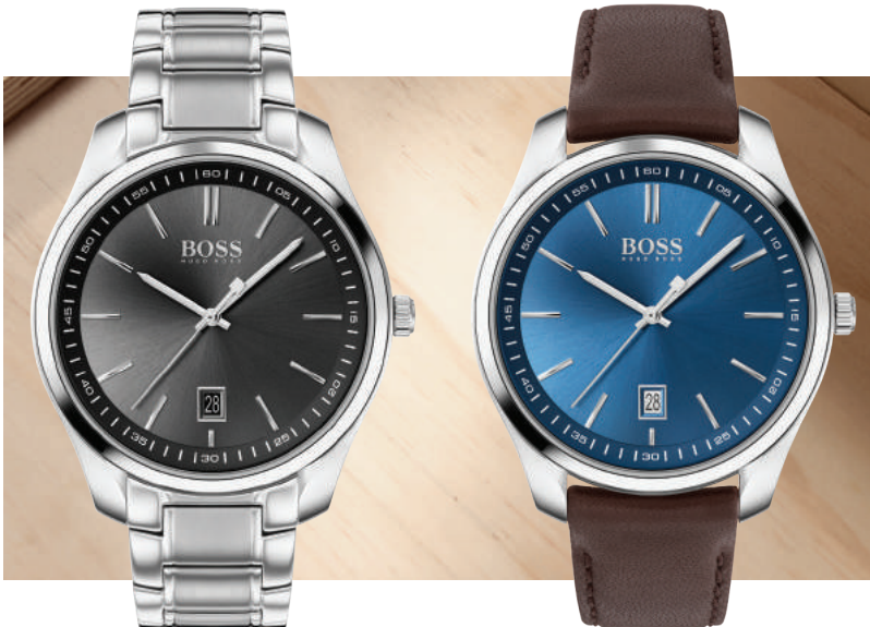
HB1513730 € 249,-